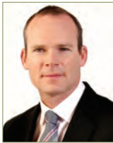
Simon Coveney, T.D.